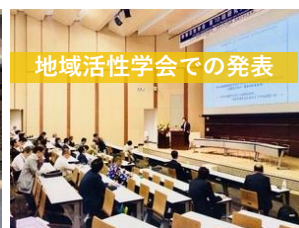
地域活性学会での発表