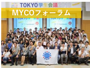
TOKYO学生会議2018 MYCOフォーラム