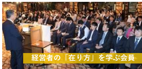
経営者の「在り方」を学ぶ会員