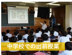
中学校での出前授業